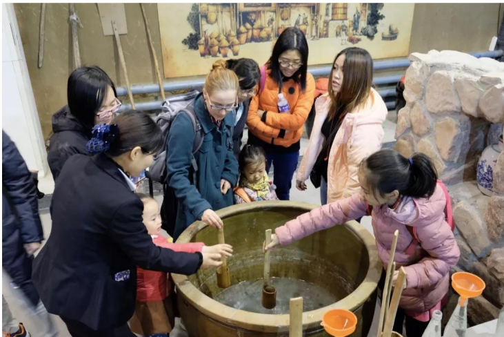
Part 2 : 制作烧饼

11月10日周六上午，在“密云三烧”文化体验馆开展了由中国政法大学国际教育学院组织的“密云三烧”文化交流活动。参与者来自世界各地，有汉语言专业的乌兹别克斯坦、缅甸等国的学生，中欧法学院的德国波兰等国学生，还有研究生院的学生。这是一次跨院校跨国界的社会实践活动。