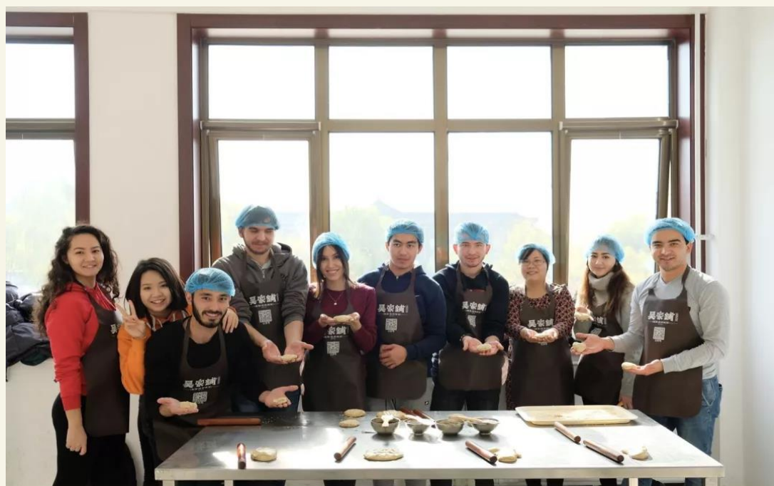
变身“烧饼制作师”的同学们。

中国政法大学港澳台教育中心 Education Center of Hong Kong, Macau and Taiwan Students, CUPL