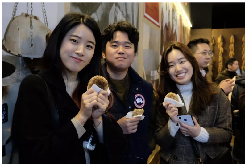
Part 3: 走进民居、体验生活

到达密云三烧文化体验馆后，外国同学们首先与各自的语伴互相进行自我介绍，汉语与英语的混合语句使同学们间的交流障碍逐渐消失。体验开始前密云烧饼的品，来自世界各地有着不同母语的同学老师们聚在一起细细咀嚼着小小烧饼中传承了500年的美味。