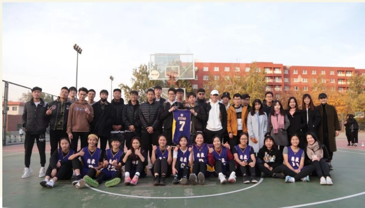
国教女篮 2018 冠军杯篮球赛夺魁合影。

中国政法大学港澳台教育中心 Education Center of Hong Kong, Macau and Taiwan Students, CUPL